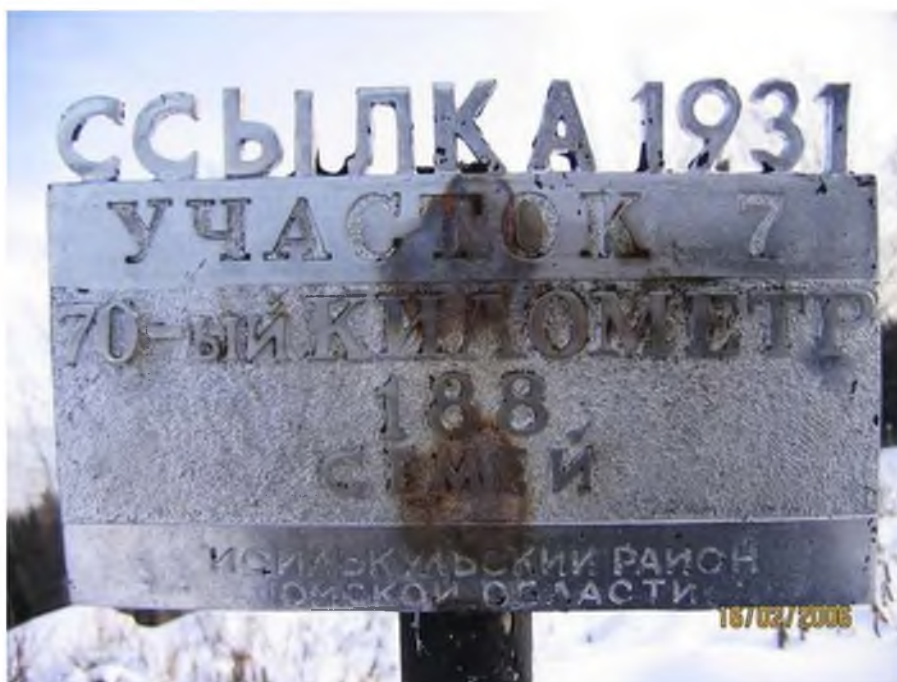
Памятная табличка на реке Чижанка. 1995 год